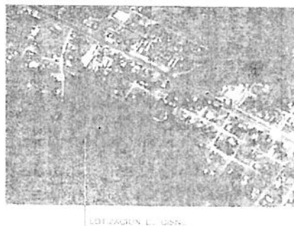
LOTIZACION EL CISNE